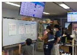
【県砂防課】 情報伝達訓練