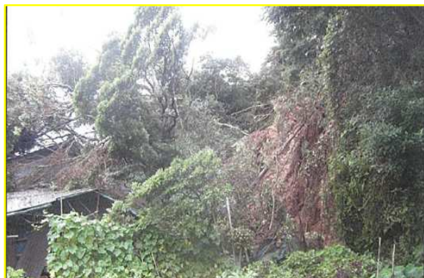
出水市高尾野町野口地区で発生したがけ崩れ(令和2年7月)