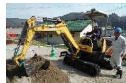
R2.2月 求名小学校(さつま町)