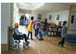
【枕崎市】 福祉避難所運営訓練(R1)