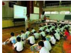
R2.6月 早町小学校(喜界町)

砂防読本を利用して、土砂災害が発生する仕組みや日ごろの備えなどについて学びました。