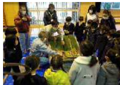
R3.1月 島間小学校(南種子町)