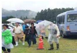
【志布志市】 住民参加による避難訓練(R1)