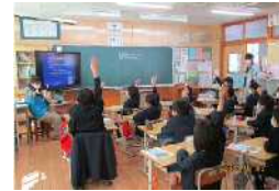
R3.2月 東原小学校(鹿屋市)