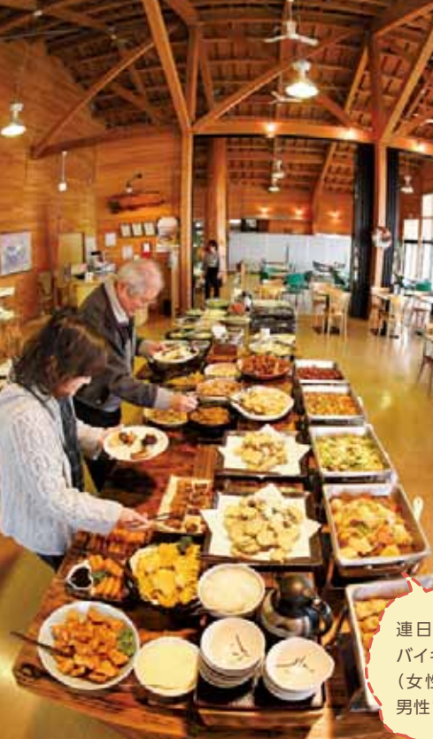
連日大人気の バイキング (女性900円、 男性1,000円)