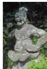
門前に建つ仁王像 は江戸時代 (1682年)の作で、 県指定文化財。

室町時代(1340年)に創建され、江戸時代には16の支院と100人以上の僧侶が学問に励んでいたという格式と由緒を誇る禅寺。明治2年の廃仏毀釈により取り壊されましたが、明治12年に再興され現在に至っています。座禅や写経の体験ができるので(事前の確認が必要)、静かに自分と向き合う時間を過ごしてみたいかが。