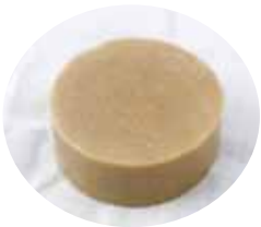
レモングラスの爽やかないい香りで至福の洗顔タイムをどうぞ。

M-Laboは、MBC開発で働く女性スタッフだけで構成しており、女性目線、消費者目線で商品を開発するチームです。「私たちスタッフ自身も欲しくなるようなものを鹿児島の素材を使用して作りたい」というコンセプトのもと、いろいろな素材を探していく中で、佐多岬のレモングラスとの出会いをきっかけに開発したのがレモングラスナチュラルせっけん「riche」です。「riche」はフランス語で「豊かな」を意味します。お肌も心も癒やされ、幸せな気分になる洗顔タイムを過ごしていただきたいと思っています。