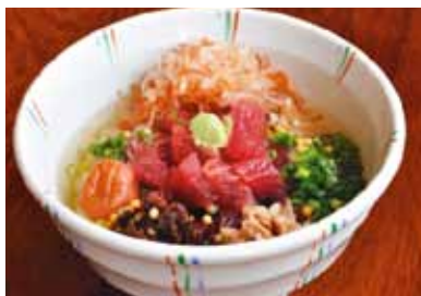
第2回チャンピオン【鯉船人めし】：枕崎市通り会連合会

皆さまの一票が、鹿児島県の第3回商店街グルメチャンピオンを決定します。県内の各商店街が誇る自慢の逸品をどうぞご賞味ください。