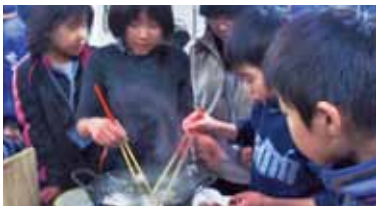
郷土料理「さつまあげ」づくり(平成23年度)

冬の厳しい寒さの中で、自然に親しみ、郷土の歴史や伝統文化にふれながらキャンプ活動をしてみませんか。