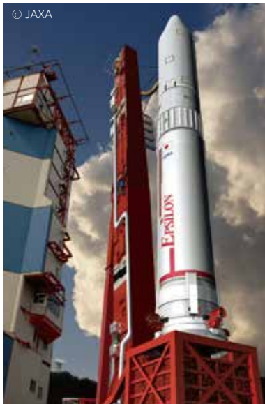
(イプシロンロケットイメージ)