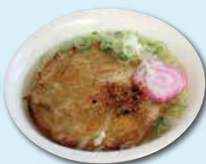
鴨池・垂水フェリー 「さつまあげうどん」

桜島フェリーと鴨池・垂水フェリーに、名物うどんあり。心地よい風を感じながら、船上で食べる一杯は格別です。フェリーごとに味わいが異なるので、食べ比べてみるのも楽しいかも。