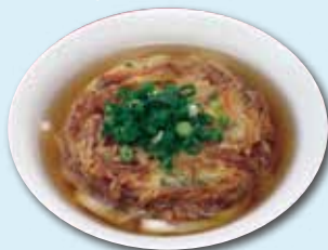
桜島フェリー 「天ぶらうどん」