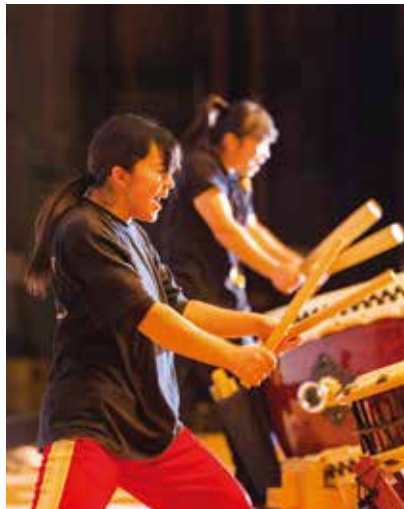
火の神乙女太鼓 爽

枕崎を拠点に活動する火の神乙女太鼓 爽。枕崎の「海・風・祭」をテーマに力強く打ち込まれる太鼓の音はまさに圧巻。見る人の魂を揺さ振ります。