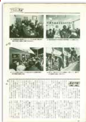
[昭和46年5月号] フラッシュ県政・県政月報 中段左写真: 集団就職列車第一号