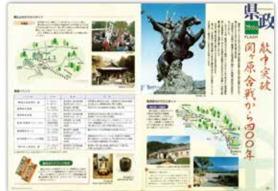
[平成12年8月号] 県政フラッシュ 敵中突破 関ヶ原合戦から400年