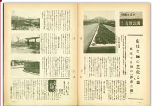
[昭和45年5月号] 開園ま近か、県立吉野公園