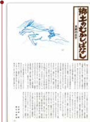
[昭和53年4月号] 郷土のむかしばなし 五郎の王子…「かごしまの昔話」とタイトルを変え、平成19年3月号まで続いたコーナーでした。