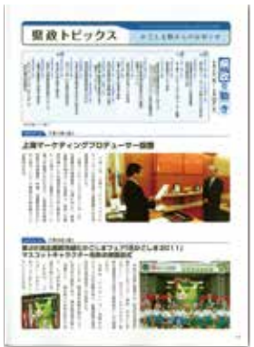
[平成21年9月号] 県政トピックス 第28回全国都市緑化かごしまフェア 「花かごしま2011」〜くりぶーお披露目〜