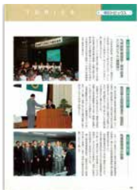
[平成17年5月号] 県政トピックス …県庁危機管理局が設置されました。

市町村合併により、それまで96市町村(14市73町9村)だった鹿児島県は、平成16年10月12日の薩摩川内市の合併から、平成22年3月23日の始良市の合併までで43市町村(19市20町4村)に生まれ変わりました。