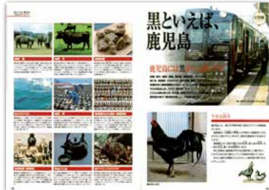
[平成17年1月号] 小特集 黒といえば、鹿児島