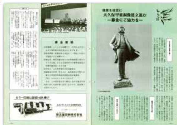
[昭和54年4月号] ひろば 大久保甲東(利通)公銅像の募金協力記事