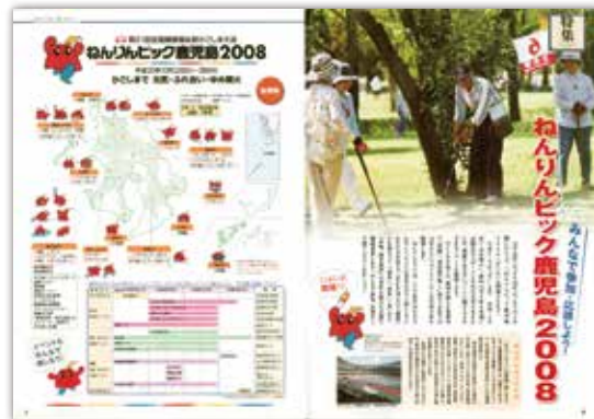
[平成20年9月号] 特集 ねんりんピック鹿児島2008