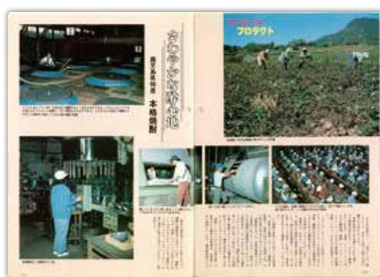
[昭和55年12月号] スペシャルプロダクト 鹿児島県特産 本格焼酎