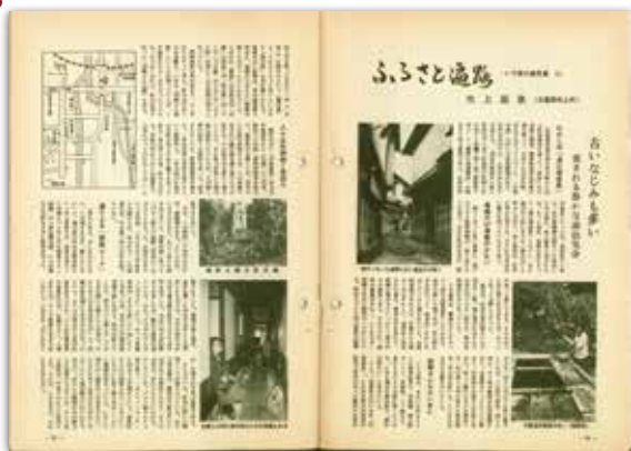
[昭和48年4月号] ふらと通路シリーズ いで湯の鹿児島 吹上温泉 …昭和50年3月号まで続きました。

県道20号線・荒田八幡交差点に信号機を設置する様子や当時の交通事情について紹介しています。進行する車社会への対応や道路整備、交通安全を県民の皆さんへ呼びかけています。