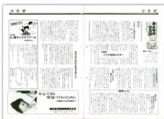
[昭和57年6月号] みんなのひろば …冷蔵庫の使用方法など生活に密着した情報もお届けしていました。