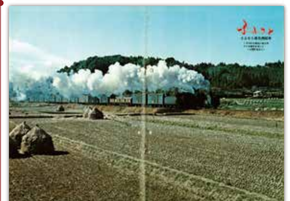
[昭和50年3月号] ふらと さよなら蒸気機関車 …南九州から姿を消した蒸気機関車の走る風景