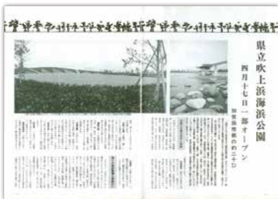
[昭和61年3月号] 特集 県立吹上浜海浜公園オープン