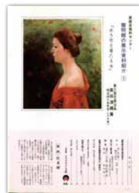
[昭和58年4月号] 表紙扉 県歴史資料センター 黎明館の展示資料紹介シリーズ