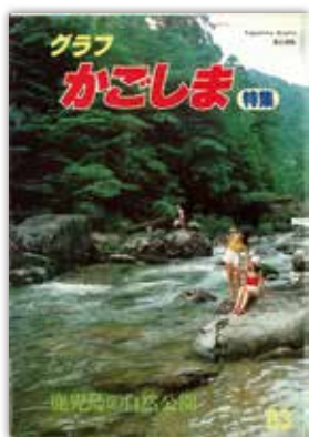
[昭和58年3月号] 表紙 特集鹿児島島の自然公園…通常発行に加え、特集号も発行していました。

九州新幹線鹿児島ルート的重要性を説明する特集記事です。当時、鹿児島から大阪へは8時間30分で行くところを新幹線が開通すれば5時間30分で行けると紹介しています。 現在は、新大塚まで最速で3時間42分で行くことができるようになりました。