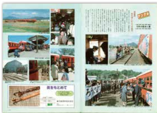
[昭和59年4月号] アングル 南薩線廃止までの70年に及ぶ歴史