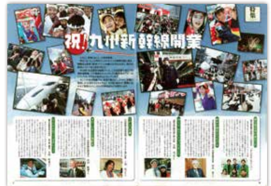
[平成16年5月号] 一特集一 祝!九州新幹線開業 …平成23年3月に鹿児島ルートが全線開業しました。