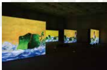
「百年海図巻」アニメーションのジオラマ チームラボ

光をテーマに鏡やレンズ、紙を素材とした作品を通して、人が光に包まれたときに感じるさまざまな感覚を呼び起こす作品