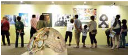
かごしまアートフェスタ2013

こうした地理的条件とアジア諸国との交流の歴史、恵まれた地域資源を生かし、鹿児島県をアジアに開かれた日本の南の玄関口としてさらに活性化させるため、アートを通じて県民の皆さんにかごしまの魅力を再発見する機会としていただくことを目的としています。