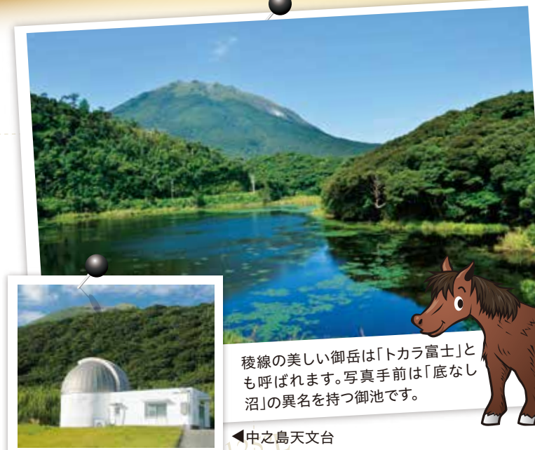
稜線の美しい御岳は「トカラ富士」とも呼ばれます。写真手前は「底なし沼」の異名を持つ御池です。

中之島はトカラ列島の中で、面積が最大で人口も最多の島です。かつては村役場が置かれ、昭和31年に役場本庁が鹿児島市に移転したあと、も支所（平成19年3月に廃止）がありました。現在も、十島開発総合センターや歴史民俗資料館といった公共施設があるなど、十島村の中心的な役割を担っています。