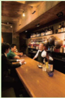
焼酎バーS.A.O (鹿児島市)

平成12年から、天文館に店を構える。 常時120種類以上の焼酎をそろえ、 客の好みに合った焼酎を出してくれる。 「いらっしゃい。今日も来たのかよ」と、 常連客との遠慮のない会話が始まる。 うまい焼酎と陽気な笑い声で、今夜も夜遅くまで盛り上がる。