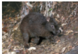
▲ アマミノクロウサギ