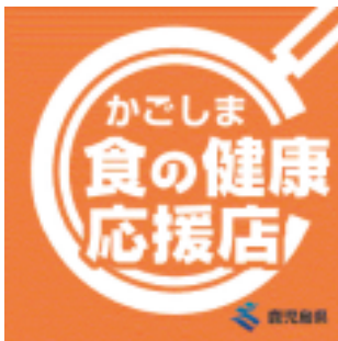
▲登録店ステッカー