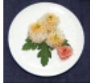
▲しいたけしゅうまい (昨年の最優秀賞)