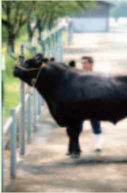
あいらふじ 「吾平藤」号 (曾於市)

黒い毛並みが美しく輝く鹿児島黒牛「吾平藤」号。 背中の高さは147cm、体重は750キ ロを超える。この度、日本一の肉牛を 生む種雄牛となった(関連8ページ)。