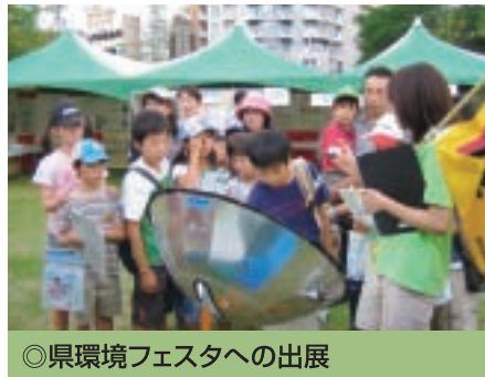
◎県環境フェスタへの出展