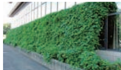
緑のカーテンづくり

民間団体が行う県民への地球温暖化防止の普及・啓発活動に対して、事業費の一部を助成し、県内の地球温暖化対策のより一層の推進を図ります。