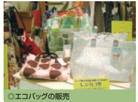
◎エコバッグの販売