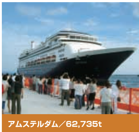
アムステルダム / 62,735t