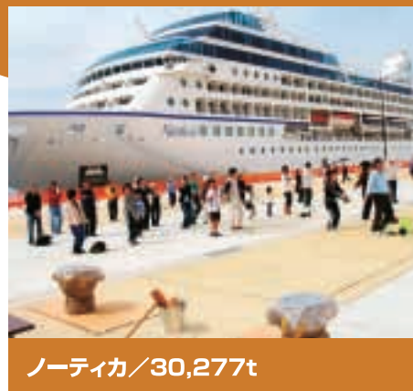
ノーティカ / 30,277t