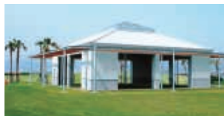
●完成した防災シェルター（平常時の状況）

「マリポートかごしま」の「防災シェルター」が4月に完成しました。この防災シェルターは、災害時の一時宿泊施設としての機能を果たし、平常時には来園者の休憩やイベントスペースとして利用できます。（災害時には、80人が一時宿泊可能）