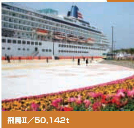
飛鳥II / 50,142t