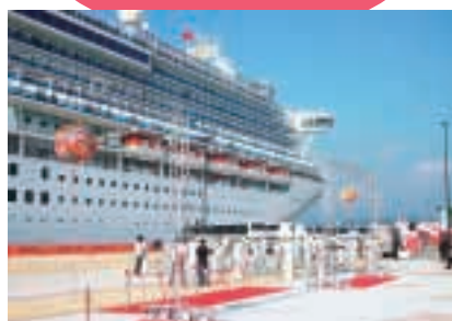
オープン時に寄港した「サファイア・プリンセス」