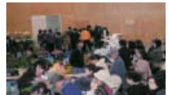
大にぎわいの農産物販売