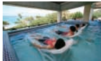
タラソ奄美の竜宮

「長寿の島」として知られる奄美大島の健康 長寿の秘訣を体感する3日間のツアーで、島 唄・島踊り、タラソテラピー、金作原生林で の森林浴散策、長寿食材を使った健康料理メ ニューをお楽しみいただけます。奄美は「花粉 症のない島」。花粉症の方は花粉の飛散時期 での来島もオススメです。