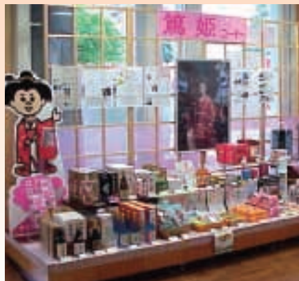
「鹿児島ブランドショップ」(県産業会館1階)