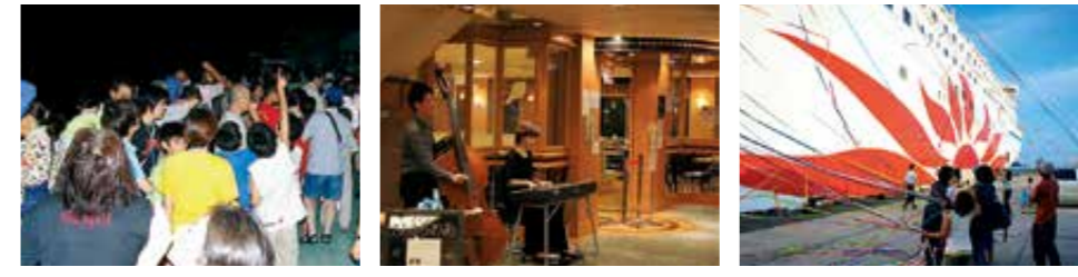
大人気☆星空教室 Music Night♪ 紙テープ投げ