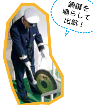
銅鑼を鳴らして出航！