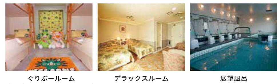
ぐりぶールーム (かごしまPRキャラクター) デラックスルーム 展望風呂