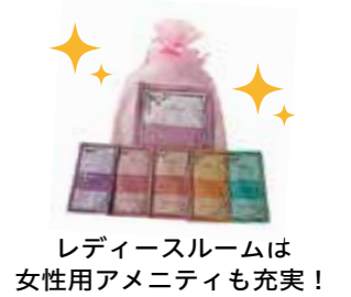
レディースルームは女性用アメニティも充実！