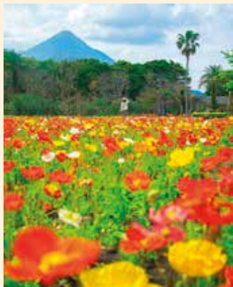
表紙写真 フラワーパークかごしま（指宿市山川） 薩摩富士といわれる開聞岳を望み、 四季を通して、約 40 万本の植物が園内 を彩ります。