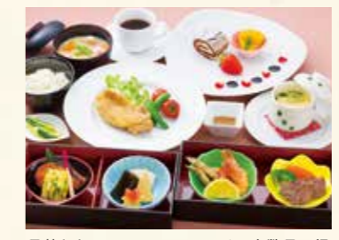
月替わりのスペシャルランチで奇数月に提供される、出水市の「農園レストラン三蔵」による和会席風コース。 ※料理写真はイメージです。

春の味覚である竹の子の煮物に、昆布巻き、あきた牛のステーキ、阿久根産のタカエビとキビナゴの天ぷらなどを品よく詰めたお重から始まる、地域食材にこだわった和風コース。メイン料理は、三蔵特製の和風ソースで味わうジュシーなみずみずりのソテー。野菜をたっぷり使った滋味豊かなさつま汁に、鹿児島県の米どころ伊佐地方のご飯で、鹿児島島の「食」を心ゆくまで堪能できます。