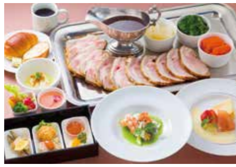
スペシャルランチ(黒豚みかく亭) 月替わりのスペシャルランチで偶数月に提供される、自社牧場のかごしま黒豚を堪能できるフルコース。