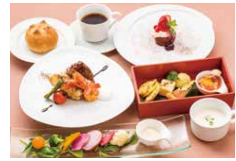
クルージングディナー(鶴の屋) 食材の美味しさを十分に引き出した、ダブルメインのコース料理。前菜からデザートまで、新鮮な感動に満ちている。

「飲食付きパッケージプラン」が「乗車のみプラン※」をお選びいただけます。 ※区間運賃+座席指定料金(大人1,400円/小人700円)