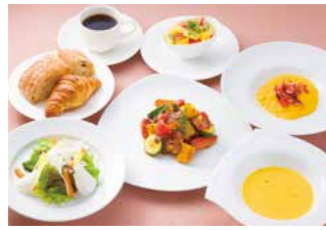
ブレックファスト(海とタヤけ) 料理長の技が光るこだわりのスクランブルエッグのほか、地元の野菜をふんだんに使った華やかな朝食メニュー。