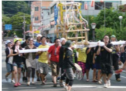
生涯学習体験(奄美祭り参加) [ゆずり葉の郷(奄美市名瀬長浜町)]