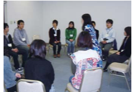
コミュニケーション能力アップ講座 [若者就職サポートセンター] (鹿児島市東千石町)