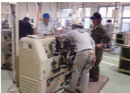
職業訓練(旋盤「機械加工作業」) [雇用・能力開発機構鹿児島センター] (鹿児島市東郡元町)

(※2) 子ども・若者総合相談センターだけでは対応が困難な案件については、センターとかごしま子ども・若者支援地域協議会が緊密な連携を図りながら、それぞれの専門性を生かして発達段階に応じたきめ細かな支援を行います。協議会では、教育、福祉、保健、医療、雇用などの関係機関・団体が行う支援を適切に組み合わせることで、効果的かつ円滑な支援を実施するため、必要な情報交換や支援の内容に関する協議を行うなど、関係機関・団体の協力体制の確立を図ります。