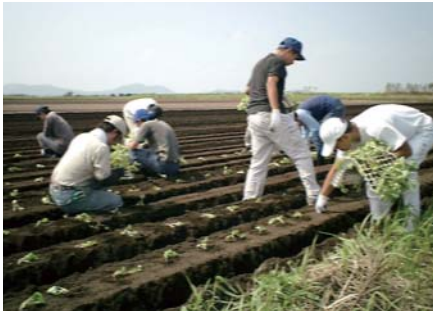
農業体験(キャベツの苗植え) [静活館(指宿市山川成川)]