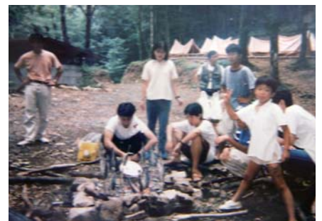
生活体験学習(吹上浜海浜公園でのキャンプ) [フリースクールIHセンター] (鹿児島市上荒田町)

【問い合わせ先】 県庁県民生活局青少年男女共同参画課 ☎099-286-2556