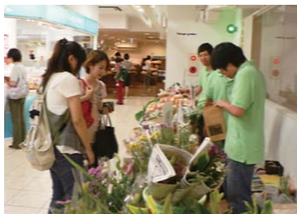
就業体験活動 (鹿児島市内のデパートでの販売活動) [麻姑の手村(鹿児島市慈眼寺町)]