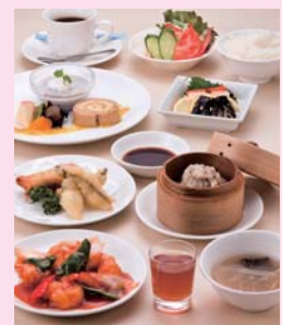
レディースランチ 税込1,575円