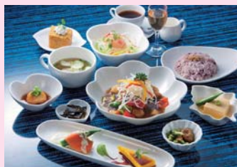
ランチメニュー 税込1,500円

自家菜園で収穫した新鮮な有機野菜と2年以上熟成させたまろやかな黒酢を使ったランチがお薦め。メニューは月替わりで、選べるメイン料理に季節に合わせた食前酢、前菜、小鉢、ご飯、スープ、デザート、コーヒーがつき、おなかいっぱい。なんとコーヒー以外のすべてのメニューに黒酢が使われています！お土産に黒酢ドレッシングもお薦めです。