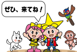
岡山県マスコット ももっち・うらっちと仲間たち

現代美術家の作品をはじめ、演劇、ダンス、音楽など多彩な表現により、おかやま文化を発信するとともに、街を巡る人々が、文化を感じ、楽しむことで、新たな文化の創造と文化を核とした地域づくりを目指すアートプロジェクトです。アートに彩られた岡山で芸術の秋をお楽しみください。