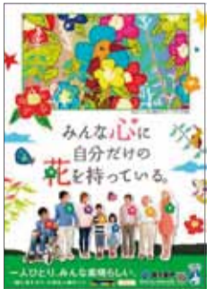
平成25年度人権啓発ポスター

これらの人権問題を解決するためには、県民一人ひとりがお互いの人権を尊重し、偏見や差別のない社会の実現に向けて意識を高めていくことが大切です。この機会に、皆さんも身近なことから人権について考えてみませんか。