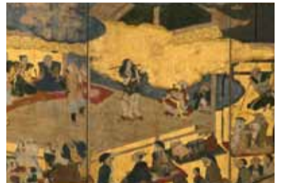
《阿国歌舞伎図屏風》(部分) 京都国立博物館蔵【重要文化財】