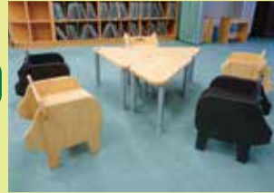
(株)久永・(株)岡村製作所