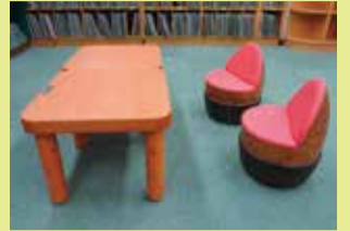
(有)松田デザイン室

デザイン・機能性に優れたすてきな木のテーブルと椅子のセット。木の温もりに包まれて、読書をしてみませんか。