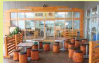
直売所百菜(伊仙町)