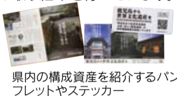
県内の構成資産を紹介するパンフレットやステッカー

県内の構成資産について、県内外の方々に広く知っていただき、世界遺産登録に向けた機運を高めるための取り組みを行っています。