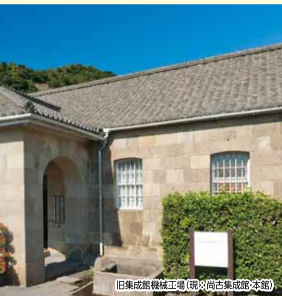
旧集成館機械工場(現:尚古集成館本館)