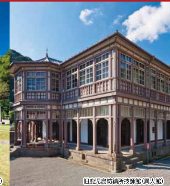
旧鹿児島紡績所技師館(異人館)

現在の尚古集成館本館(鹿児島市)など九州・山口と関連地域が、本年度、(機関)の世界文化遺産※に推薦されること、国や関係自治体とより一層緊密になります。