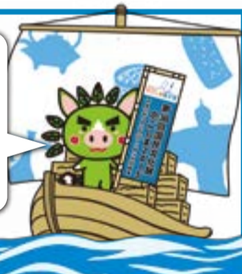
第30回国民文化祭・かごしま2015 マスコットキャラクター「ぐりぶー」

国民文化祭とは 全国各地からアマチュアを中心とした文化団体や愛好者が集まり、各種文化活動の成果を発表・競演・交流する、国内最大の文化のイベントだぶー! みんな期待してぶー!