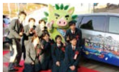
松陽高等学校美術部の皆さん

「黒潮」の響きと豊かさをもたらすさまざまな「海(SEA)」の財産を躍動的にイメージして、「クロッシー」と名付けられたキャラバンカー。ラッピングデザインは松陽高等学校美術部の皆さんが考えてくれました。