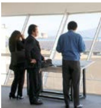
ソーラー科学館から太陽光パネルを見ることができます