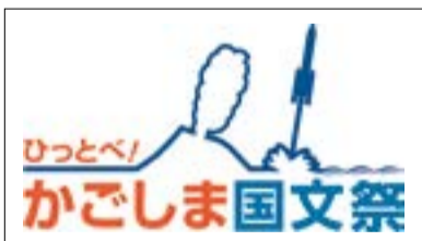
大会愛称ロゴマーク

分野別フェスティバルでは、7つのテーマを柱に43すべての市町村で、鹿児島らしさあふれる事業を開催するんだぶー