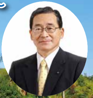
鹿児島県知事 伊藤祐一郎