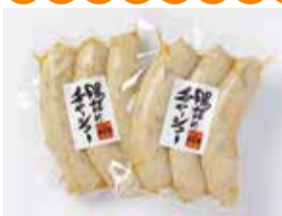
2013かごしまの新特産品コンクール 鹿児島県観光連盟会長賞

黒豚腸詰 チャーシュー 2袋セットを5名様 (有)島田屋 鹿児島市上本町15-9 ☎099(226)2088