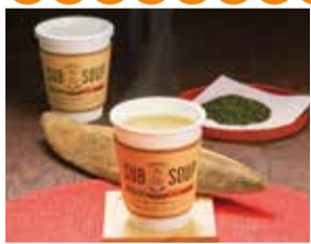
2014かごしまの新特産品コンクール 第30回国民文化祭鹿児島県実行委員会会長賞

元気が出る飲み物として古くから鹿児島で親しまれている茶節。南九州市産茶葉と指宿山川産の本枯節をみそと合わせ、深いうま味とやさしい味わいに仕上げた逸品を気軽に飲めるようカップスープにしました。