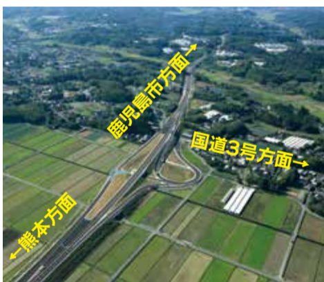
〈野田インターチェンジ〉

「出水阿久根道路」は、 無料 で通行できる自動車専用道路で、平成29年度までに全線が開通する予定です。