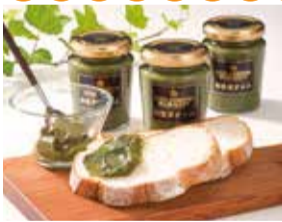
2015かごしまの新特産品コンクール 鹿児島市長賞