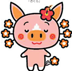
かごしまPRキャラクター 「さくら」