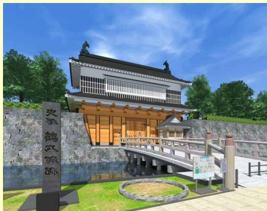
基本設計イメージ図(県建築士会作成)