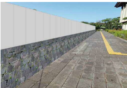
石垣と漆喰壁をイメージした仮囲い (H30.6月頃～)