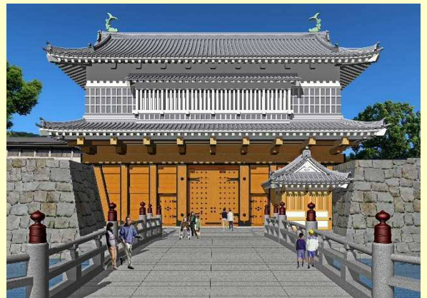
御楼門完成イメージ図