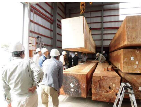
1次製材後の木材検査の様子