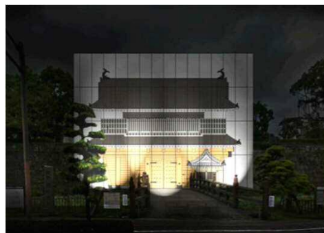
御楼門の素屋根のイメージ (H31.7月頃～)