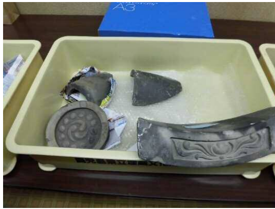
発掘された軒丸瓦, 軒平瓦など