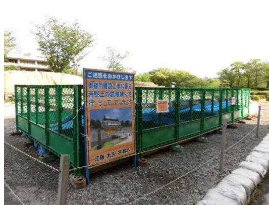
黎明館に設置の試験練りの様子 (⇒試験の結果, 日置市産の土を使用)