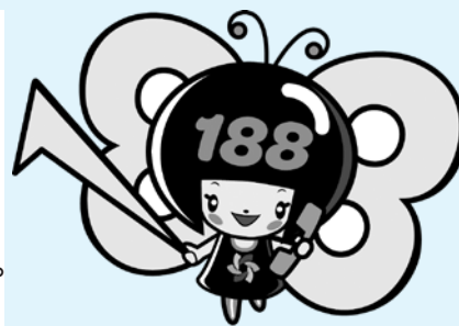
消費者庁 消費者ホットライン188 イメージキャラクター イヤヤン

★マイライフかごしまは今年で発刊50周年を迎えます。これからも”くらし”に役立つ情報を発信していきます!!