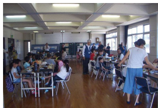
ひまわりハウスでの「わいわい食堂」

また、子どもたちの学習支援を行う「なぎさ未来塾」や子ども食堂「わいわい食堂」といった、子どもたちの居場所づくりにも取り組んでいる。地域住民が学習支援や食事作りなどを行うため、子どもの貧困や孤独に対する取組となるだけでなく、世代間を超えた幅広い交流の場となっている。