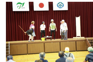
認知症を想定した寸劇