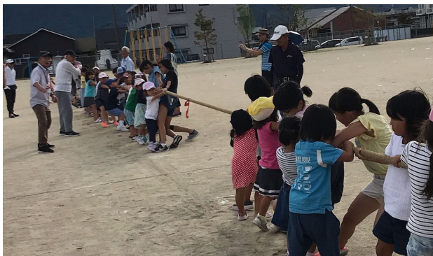
十五夜での綱引き