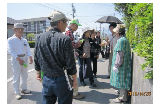
認知症模擬訓練写真

育てることで、地域全体で認知症高齢者やその家族を支える体制づくりを図っている。また、このような活動を通して、住民の高齢者に対する理解を深め、高齢者が認知症になっても住み慣れた地域で安心して生活できるようなまちを目指している。