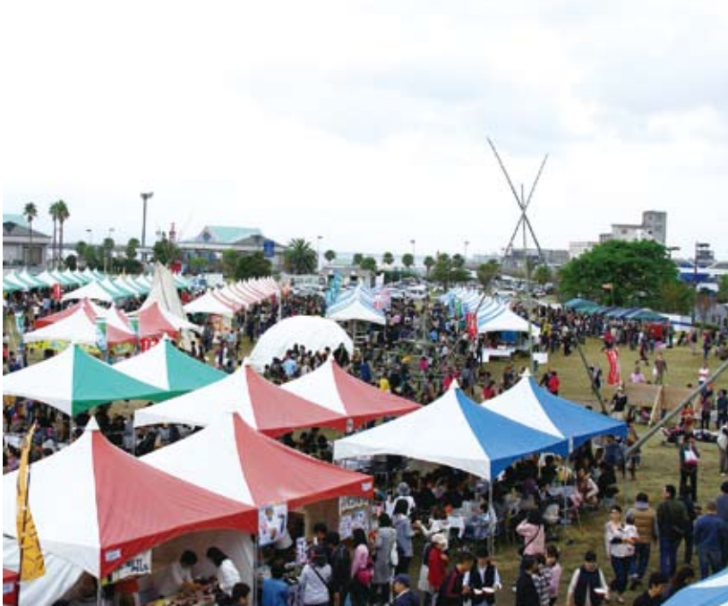
オーガニックフェスタかごしま

有機JAS認定に関する業務を行う登録認定機関であり、食の安全、有機農業の発展、環境の保全等に関する活動を行うNPO法人です。