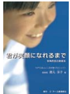
徳丸理事長著 「君が笑顔になれるまで」 (ジアース教育新社)

いじめ、不登校、生き辛さを抱えている方とご家族の心のケア、関係機関との連携等を行っています。