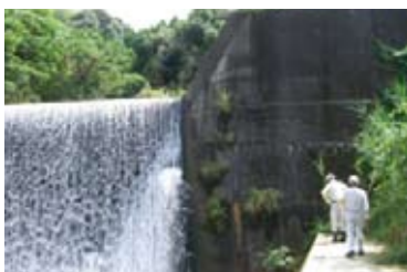
砂防施設等の防災点検活動

毎年、4～5回に分けて離島を除く700箇所程度の砂防施設、急傾斜地崩壊防止施設、地すべり防止施設などの土砂災害対策施設の点検を実施しています。