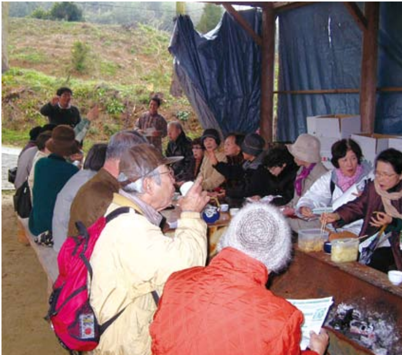
県農村振興課の委託事業として実施したグリーン・ツーリズムのモニターツアーの様子 (出水市高尾野町竹崎農園 H21.1.22)