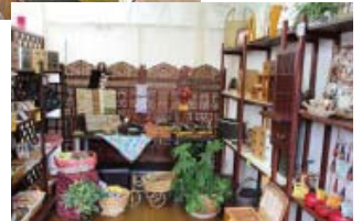
ろう者・ろう重複者地域活動支援事業(障害者小規模作業所)