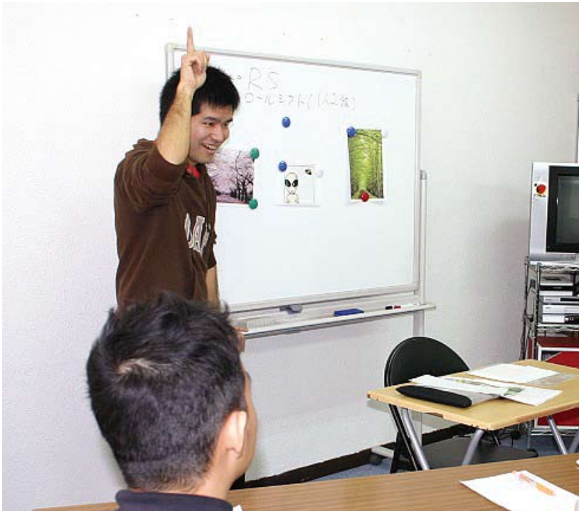
JSLかごしま手話クラス(JSLとは、Japanese Sign Language(日本語手話)の略称です。)