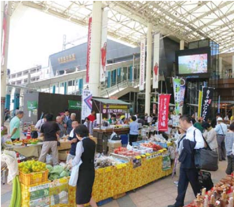
かごしま特産品フェア