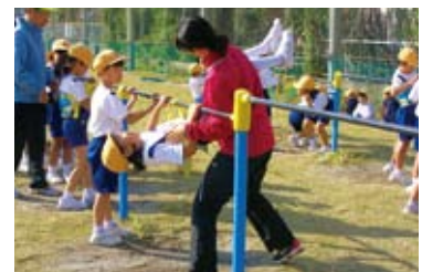
小学校体育授業サポートスタッフ派遣

スポーツ指導者を各団体・個人に派遣します。文部科学省から委託を受け、鹿児島市内の小学校の体育授業にも指導者を派遣しています。