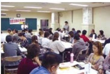
NPO法人の活動啓発事業

運営方法がわからない、事業の進め方がわからない等運営に関する課題を抱えている団体に対する個別指導・運営セミナー等を開催しています。