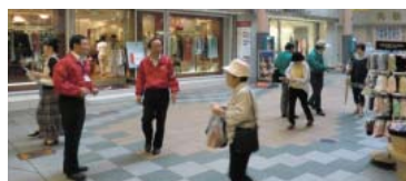
土砂災害防止月間 街頭PR活動

土砂災害警戒区域等指定に係る説明会や市町村からの要請による防災研修等において、「土砂災害」についての説明等啓発活動を行っています。また毎年6月の土砂災害防止月間には、街頭PR活動を実施しています。