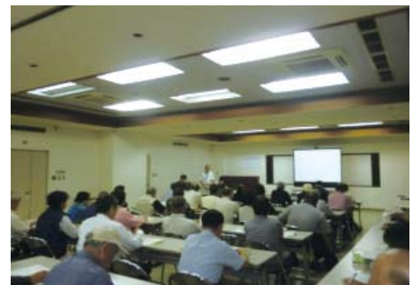
土砂災害についての説明等啓発活動

平成9年3月、鹿児島県北西部地震の発生を契機に設立され、以来砂防施設等の防災点検、土砂災害防止に係る啓発活動や土砂災害についての住民説明、さらに技術研修会を開催するなど防災活動を実施しています。