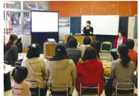
乳がん啓発セミナー

乳がん体験者のご家族の支援, 乳がん予防の啓発活動, 女性の健康を支援する活動を行う団体です。