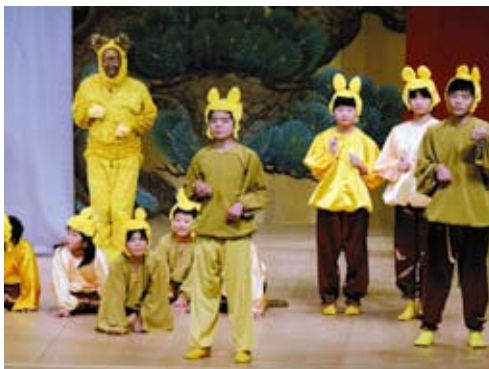
地域興し新作狂言「吉野兵六どん」。子どもたちも狐役で出演。

私たちの住む地域が「ひと」と「ひと」があたたく行き交うまちとなり、生きがいをもち、各々がもてる力を出し合いながら、あらゆる事業を展開し、豊かな地域環境を目指して、総括的に地域を見据え、住民相互のネットワークを図り、コミュニティの拠点として地域を総合的にサポートしていきます。