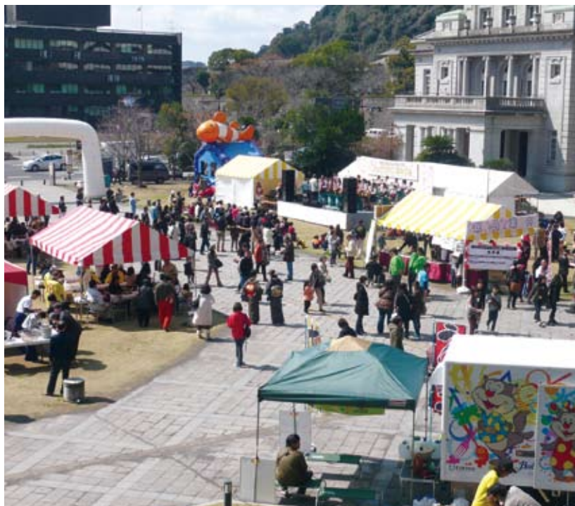
共生・協働フェスティバル