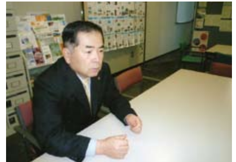
設立以来、260を超える方々の“熱い思い”をNPO法人という“形”に変えてきました。

社会に貢献したいとの熱い思いをお持ちの皆様の熱い気持ちをNPO法人という形にする活動を行っています。昨年4月、NPO法が大幅に改正されました。改正に伴う「新しい会計基準の導入」、「認定NPO法人の取得」の相談も随時行っておりますので御利用ください。