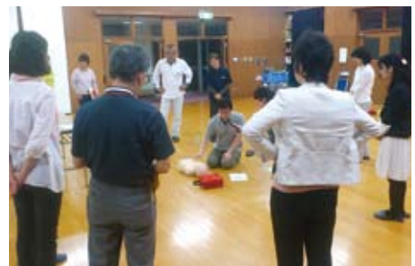
こどもの救急蘇生法について講習しています。

何かをやらねばならないと考えるのではなく、自分たちに何ができるかを考えて運営している点が当法人の特徴です。