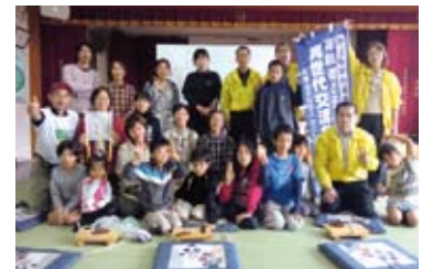
屋久島のNPO法人 屋久島環境グループと連携し、地域の高齢者と子どもたちのふれあいの場を提供しました。