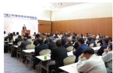
土砂災害防止に係る砂防技術研修会

本協会員はもとより、行政機関などの職員を対象に、土砂災害に対する技術強化を図るため大学教授等を講師として砂防技術研修会を開催しています。