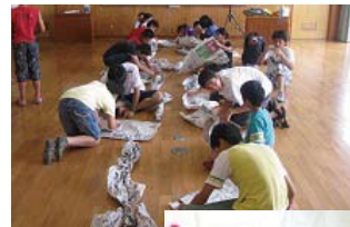
児童福祉法に基づく障害児通所支援事業

NPOデフNet.かごしまの各事業を通して、ろう者と聴者が互いに認め理解し合うバリアフリー社会の実現を目指し、またろう児・難聴児やろう者にとって心豊かな生活を送れるようサポートしている団体です。