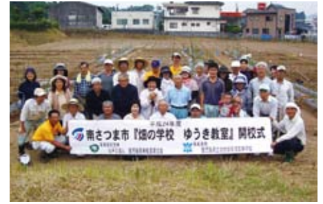
畑の学校 ゆうき教室