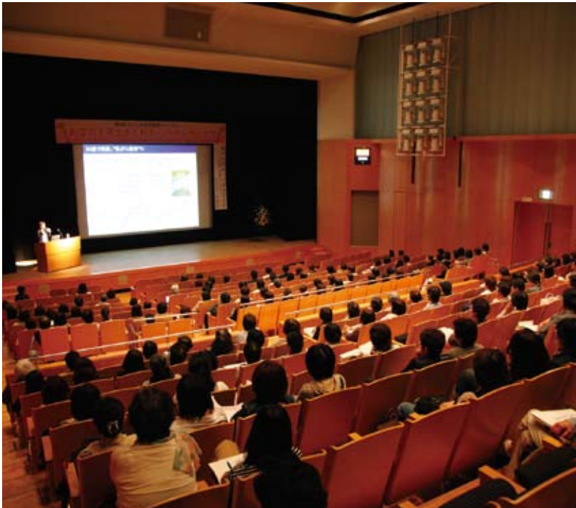
第8回かごしま女性医療フォーラム