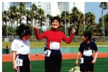
50mダッシュ王選手権

「50mダッシュ王選手権」「小学生かけっこ塾」「ノルディックウォーキング教室」など、趣向をこらしたスポーツイベントを開催しています。