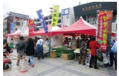
鹿児島中央駅大階段下広場にて

県産特産品のPR・販売・開発・マッチングを通じたかごしまブランドの確立と地域の活性化を目的としている団体です。