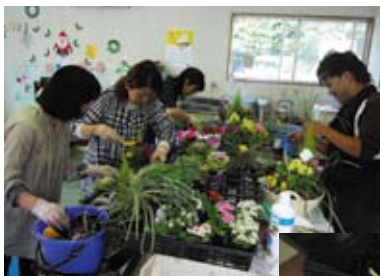
◀ マミークラブ楽々 楽しく花々をアレンジ。 素敵な寄せ植えができました。

▶ キッチンやまぼうしのお弁当 地域の人々に野菜中心の愛情 こめたやさしいお弁当を宅配。 ランチも仕出しもやっています。