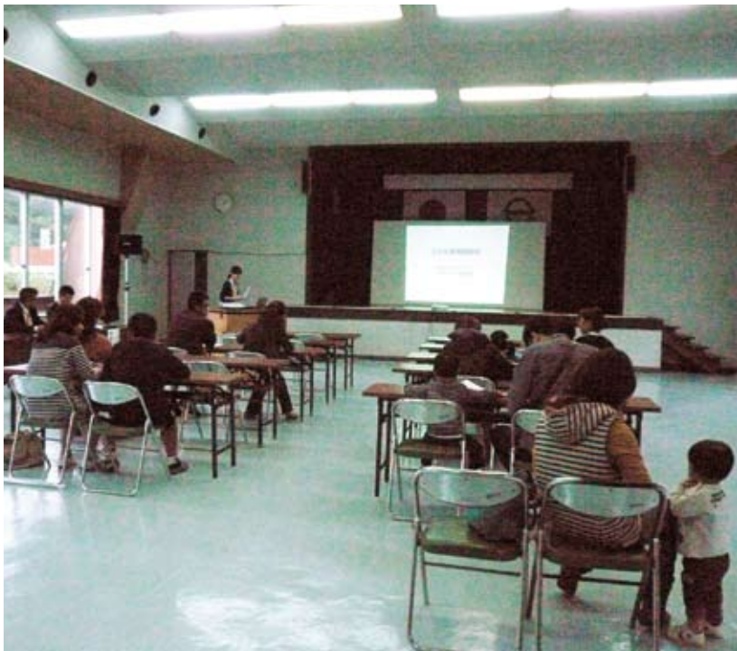
奄美大島(大和村)の相談会で乳歯の発達について講演しています。