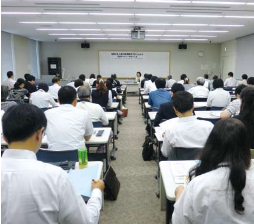
県内で先駆的に推進している「新しい会計基準」導入に向けてのセミナーの様子