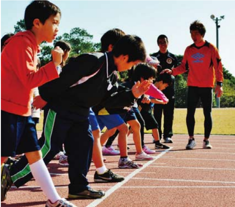
屋久島の子供たちへかけっこ教室