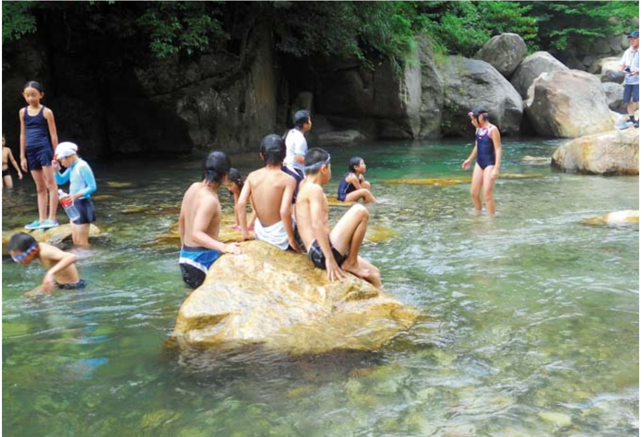
よしのっ子地域塾（平成24年は垂水市猿ヶ城溪谷で川遊び。（例年は、三島村硫黄島でキャンプを行います。）