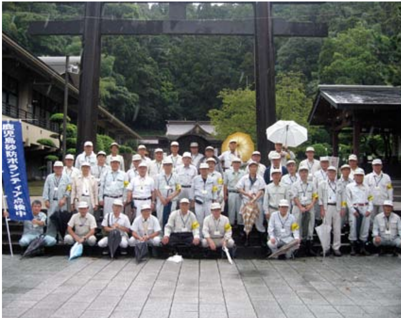
点検当日の集合写真