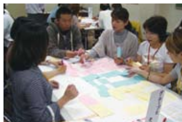
助成金申請及び活用方法の指導事業

助成金情報の収集方法がわからない、助成金申請方法がわからない等の団体に対し、個別指導を実施しています。