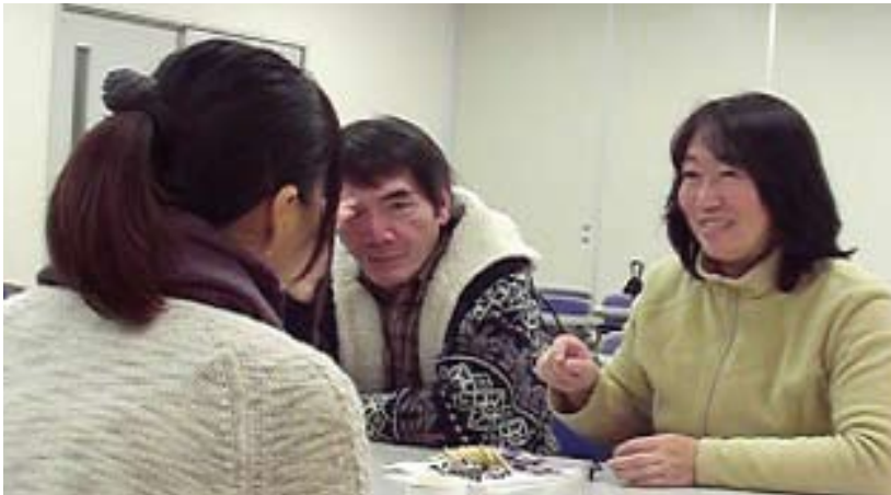
リフレッシュサロンの様子