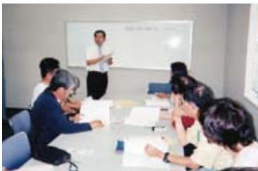
毎月、NPO法人を設立、または勉強したい方向けの「やさしく学べるNPO法人設立セミナー」を開催しています。

NPO法人設立セミナーを毎月開催。設立を支援した先は県内外265先、うち運営支援先72先。