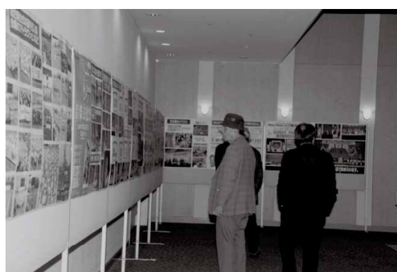
(ねんりんピック写真展示状況)