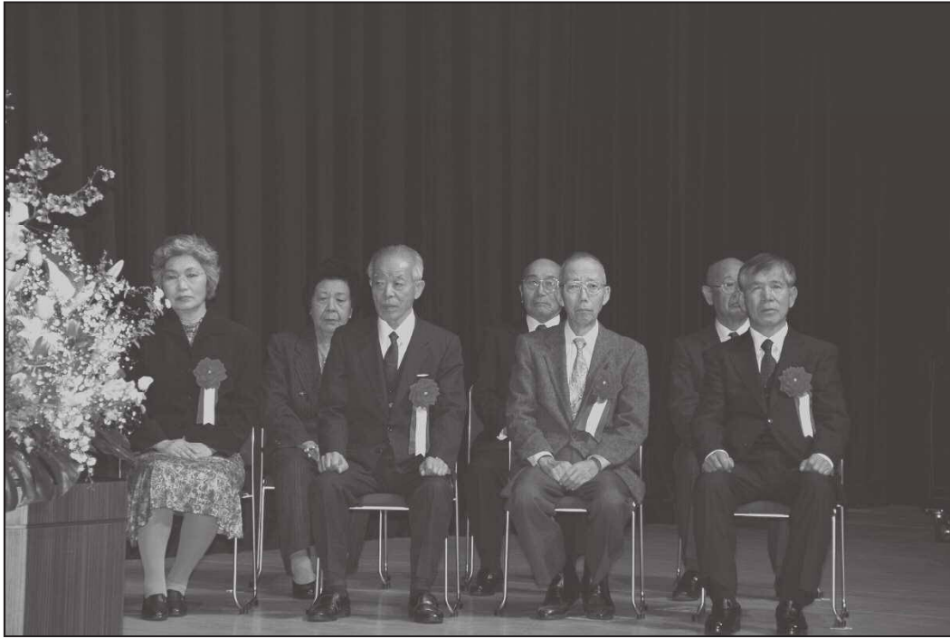
(受賞団体の皆さん)