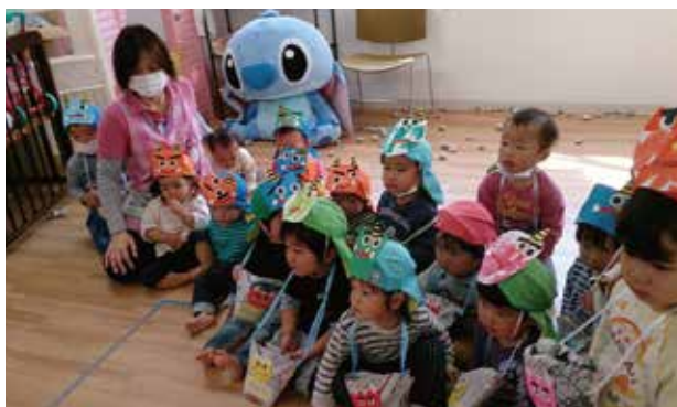
事業所併設託児所(キラキラキッズ)の子供達