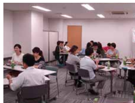
ランチョンセッションの風景

平成26年、女性社員でつくる「働くなでしこ委員会」を発足。当委員会には、子育て世代、子育て終了世代、独身者から組織横断的に12名のメンバーが集結しました。女性が働きやすい、活躍できる職場をつくるために、アンケートにより社員の声を吸い上げ、月に1回意見交換会を実施。経営層に施策を提案し、半日・1/4日単位の有給休暇制度が導入されました。学校行事等に参加しやすい環境が整ったことで、有給休暇取得率は54.6%（平成26年）から65.5%（平成28年）まで上昇しました。その他、子供が1歳になる前に育児休暇から復帰すると、保育料を補助する制度も導入されました。また、組織を超えた情報交換の場として、月に1回「ランチョンセッション」を開催し、学校や習い事における情報交換、子供の長期休暇の過ごし方等、種々のテーマについて、食事をとりながら自由に意見交換を行っています。