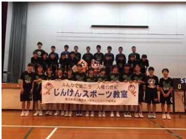
【鴨池中学校でのじんけんスポーツ教室】