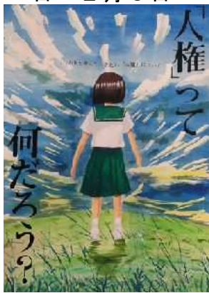
人権に関するポスターコンクール最優秀受賞作品（全体の部）