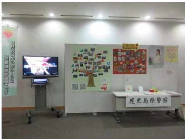
パネル展の様子(かごしま県民交流センター)