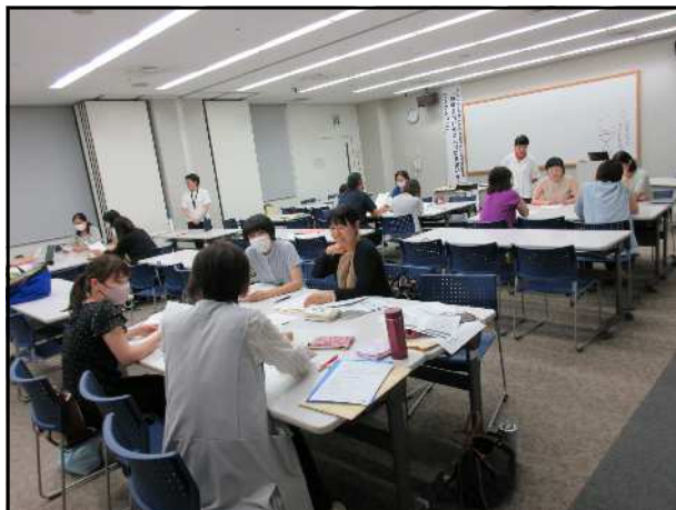
教職員向けの男女共同参画研修・ワークショップ