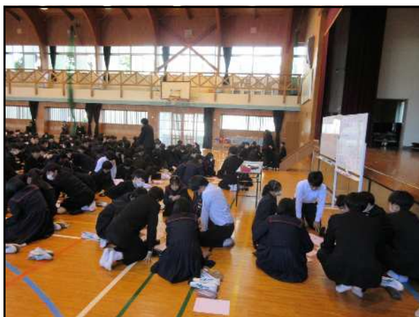
生徒を対象としたワークショップ