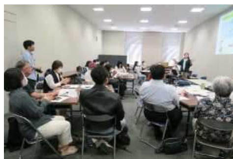
日本語サロンおしゃべりひろば