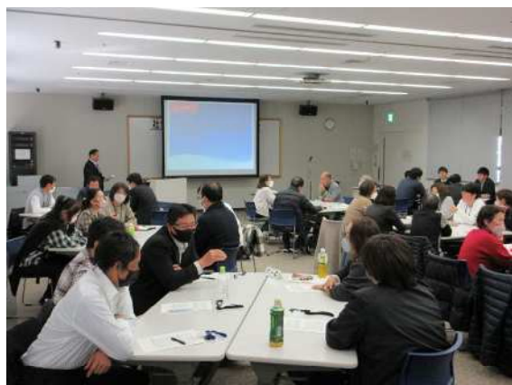
【社会教育関係団体指導者等研修会(鹿児島地区)】