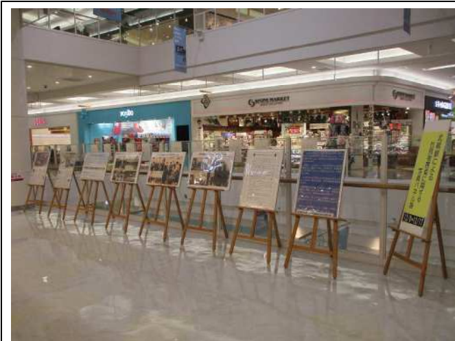
イオンモール鹿児島でのパネル展の様子