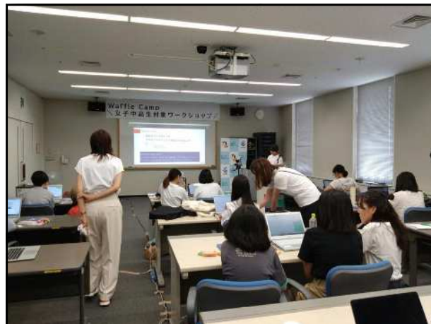
男女共同参画週間事業 Waffle Camp女子中高生対象ワークショップ