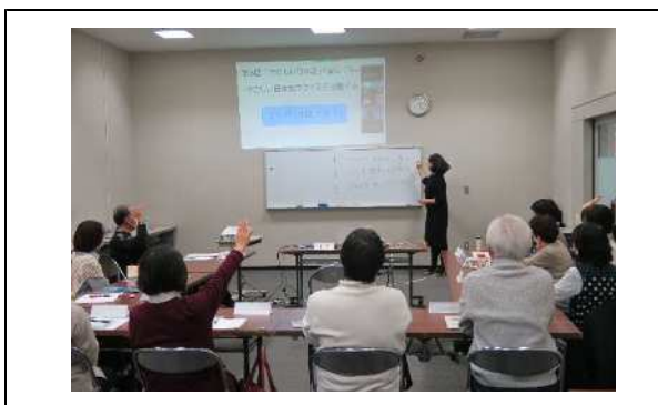
日本語ボランティア入門講座