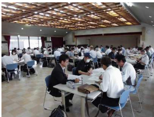
【家庭教育学級長等研修会】