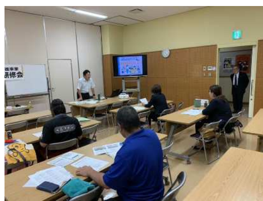
【家庭教育支援員研修会】