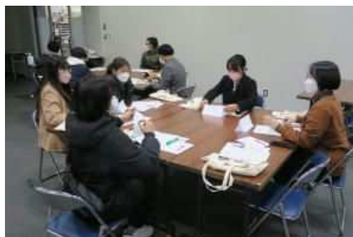
日本語・日本理解講座