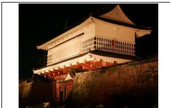
(ランドマークのライトアップ)