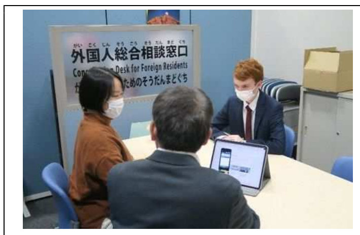
外国人総合相談窓口