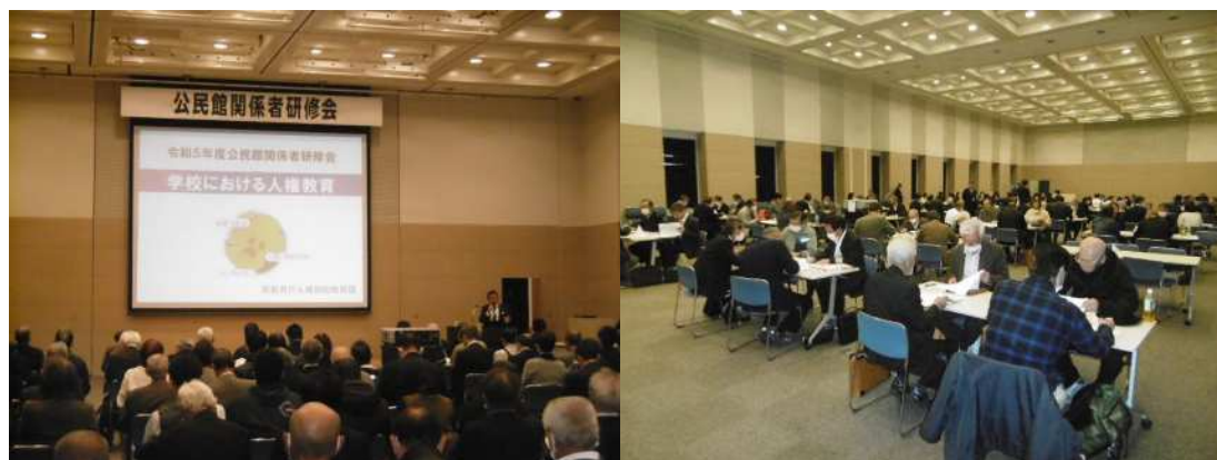
【公民館関係者研修】