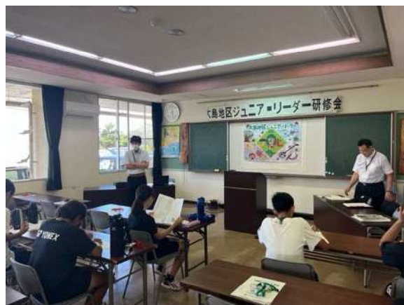
【ジュニア・リーダー研修会(大島地区)】