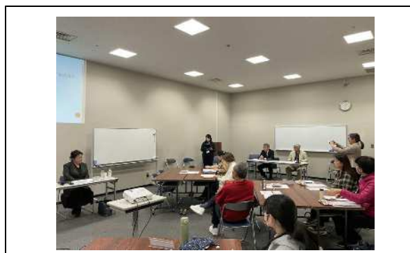
災害時外国人支援ボランティア養成講座