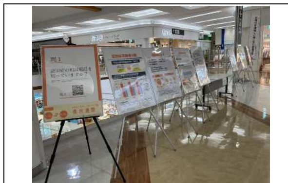
(認知症に関するパネル展)