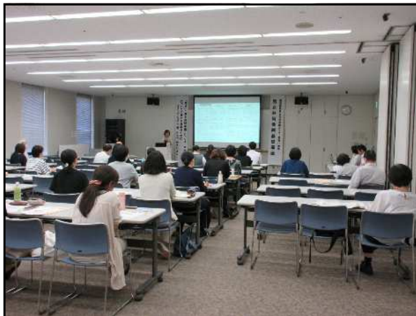
男女共同参画基礎講座