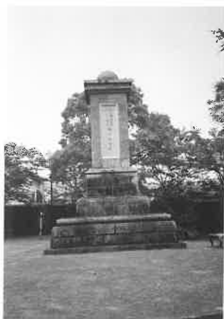
征西將軍宮懷良親王御所記念碑（史料一）