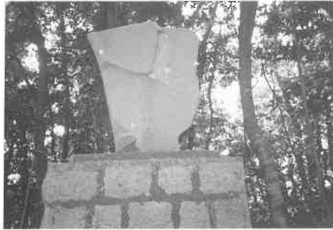
楡井頼仲卿之碑(史料三)