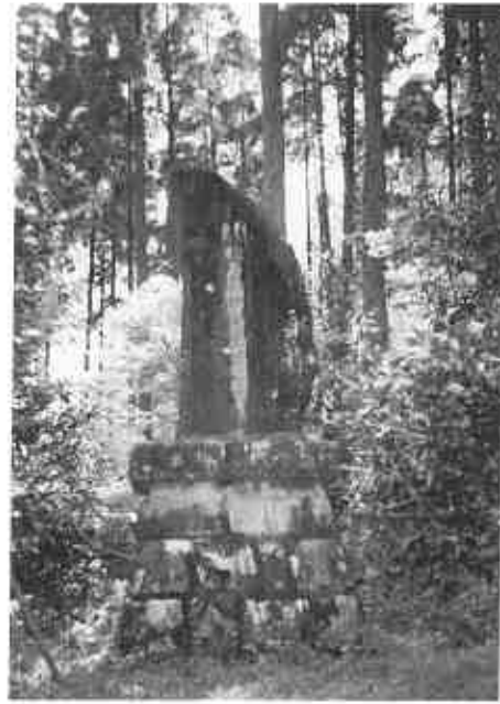
楡井頼仲公表忠碑（史料二）

【史料二】は肝属郡高山町新富の弓張城の北麓、流鏑馬で著名な四十九所神社の境内にある。この城は観応の頃楡井頼仲が居城したと伝えられていることから、建碑されたものと思われる。 (29) 同日に建立された石灯笼も神社内に現存しており、石工も同人である。