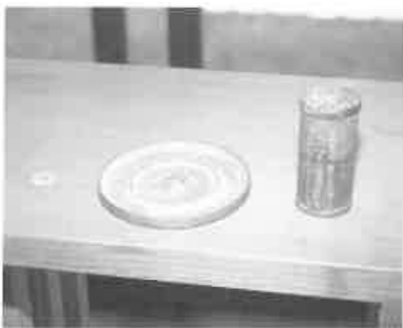
経筒・鏡・古銭 (竹田神社所蔵)