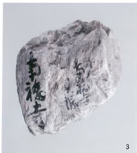
1. 阿多貝塚出土轟B式土器 2. 並木遺跡出土中尾田Ⅲ類土器 3. 南福寺貝塚出土滑石原石