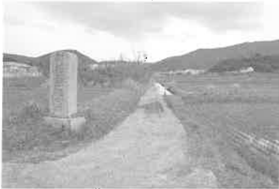
(3) 永利耕地整理記念碑地点