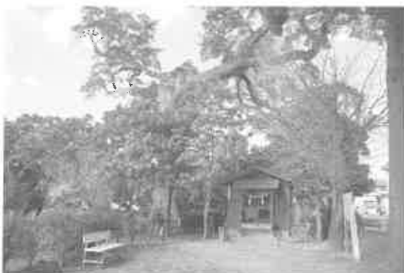
(9) 石神神社地点 (オガタマノキ)