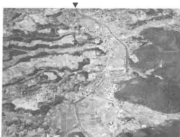
薩摩川内市航空写真

本稿は、これらの状況を紹介すると共に、今後の試掘調査に向けて、直線状の道跡の存在を予察するものである。