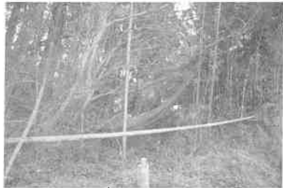
(5) 川内電力所東側地点