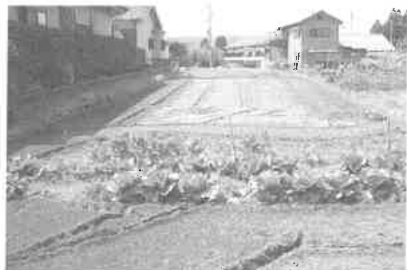
(8) 石神自治会館地点