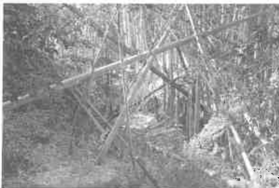
(7) 石神自治会館東側地点