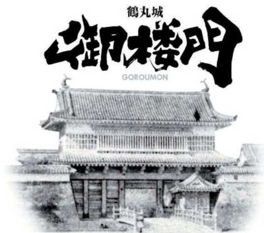
▲御楼門口 ごろうもん

令和 2 年 (2020) 4 月 鶴丸城御楼門建設協議会 つるまるじょうごろうもんけんせつぎょうかい 鶴丸城御楼門復元実行委員会 つるまるじょうごろうもんふくげんけんせつぎょうかい