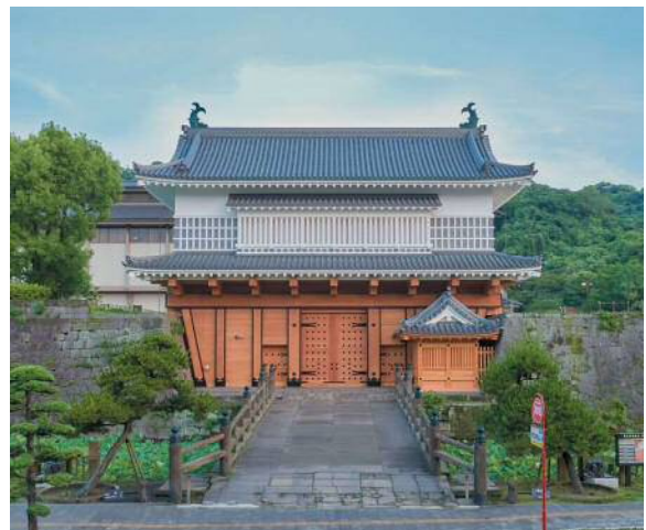
▲御楼門 ごろうもん