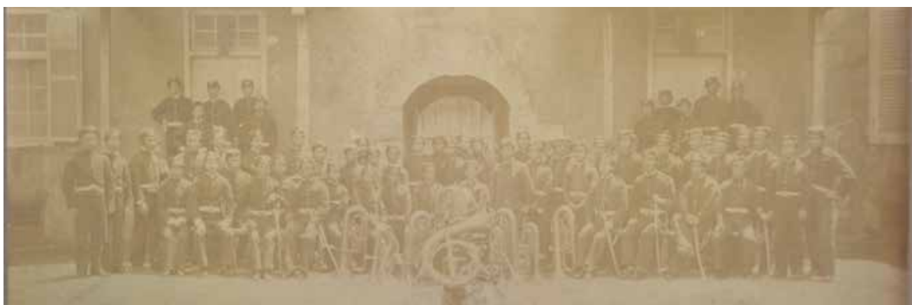
海軍楽隊古写真(部分)