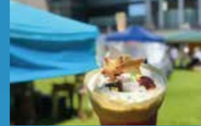
宇宙スイーツはいかが？