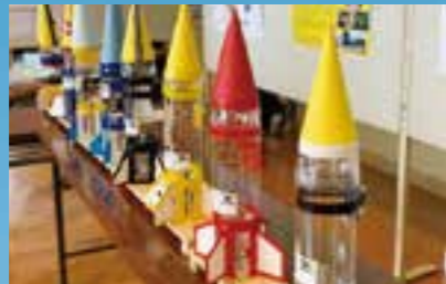
水ロケット大会に挑むロケットたち