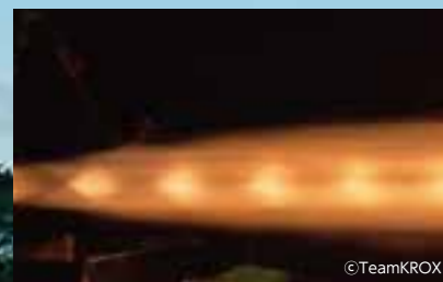
2号機エンジンの燃焼試験

将来的には超小型人工衛星を搭載した打上げを目指す、地元産の「鹿児島ロケット」。Team KROXのプロジェクトから今後も目が離せません。