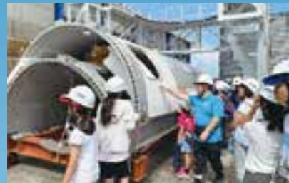
内之浦宇宙空間観測所の見学

宇宙開発の歴史とともに歩んできた肝付町内之浦の地に全国各地からたくさんのYAC団員が集い、JAXA内之浦宇宙空間観測所の見学や、水ロケットの全国大会、テーマ別ワークショップなど、3日間を通じて交流を深めました。