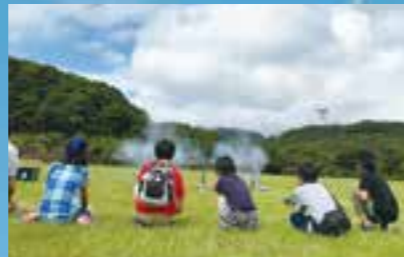
モデルロケット打上げ体験