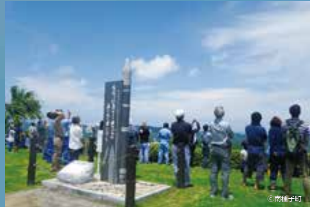
南種子町 宇宙ヶ丘公園

今後も2つの打上げ施設でたくさんのロケット打上げが行われ、着実に成功を重ねていくことを願うとともに、ここ鹿児島にしかない「宇宙」という強みを生かした取組を通じて、地域の活性化につなげていきます。