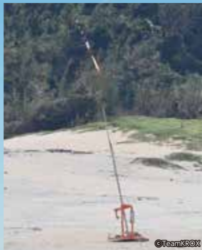
初号機打上げの瞬間