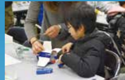
水ロケット体験教室

この日一番の盛り上がりを見せたのは、なんといってもJAXA大西卓哉宇宙飛行士の講演会。国際宇宙ステーションでの貴重な体験談に、子どもから大人まで、駆けつけた参加者たちは興味津々。大西宇宙飛行士への質問タイムは、たくさんの子どもたちが手を挙げ、会場が大きく沸きました。