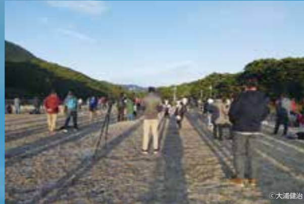
肝付町 IHI スペースポート内之浦