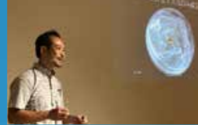
「星のおじさま」講演会

株式会社宙の駅が主催となり、産業・商業・教育・サブカルチャーなどを総合的に楽しむ宇宙フェスタ「かごしま宙の駅2019」が、かごしま県民交流センターにて初開催。鹿児島に新たな宇宙イベントが誕生しました。天文学者ら「星のおじさま」による講演会や、宇宙をモチーフにした雑貨やご飯が楽しめる「SORAマルシェ」、宇宙と芸術特別展など、ユニークなプログラムが満載。次回以降の開催にも期待大です。