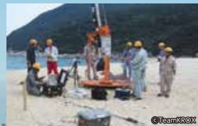
打上げ準備作業を行うメンバーたち