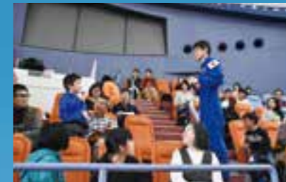
JAXA 大西宇宙飛行士講演会