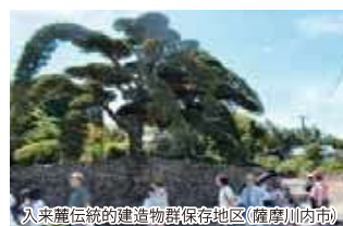
入来麓伝統的建造物群保存地区(薩摩川内市)