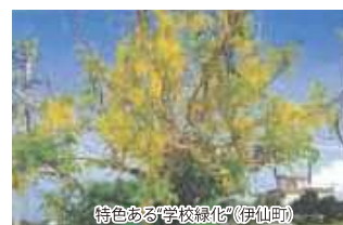
特色ある“学校緑化”(伊仙町)