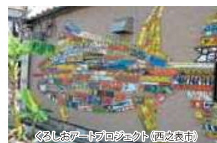
くろしおアートプロジェクト(西之表市)