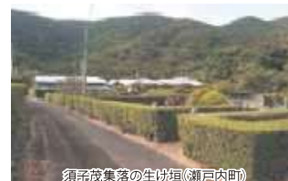
須子茂集落の生け垣(瀬戸内町)